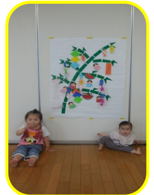
夜空に輝く七夕飾りができました☆☆