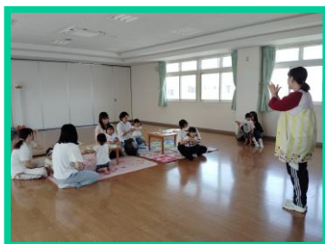
いろいろな動きができるね★