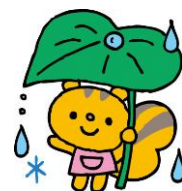
園で初めての発育測定でちょっと ぴりドキドキしちゃったね☆